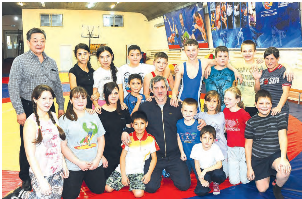
Бувайсар Сайтиев в гостях у юных спортсменов