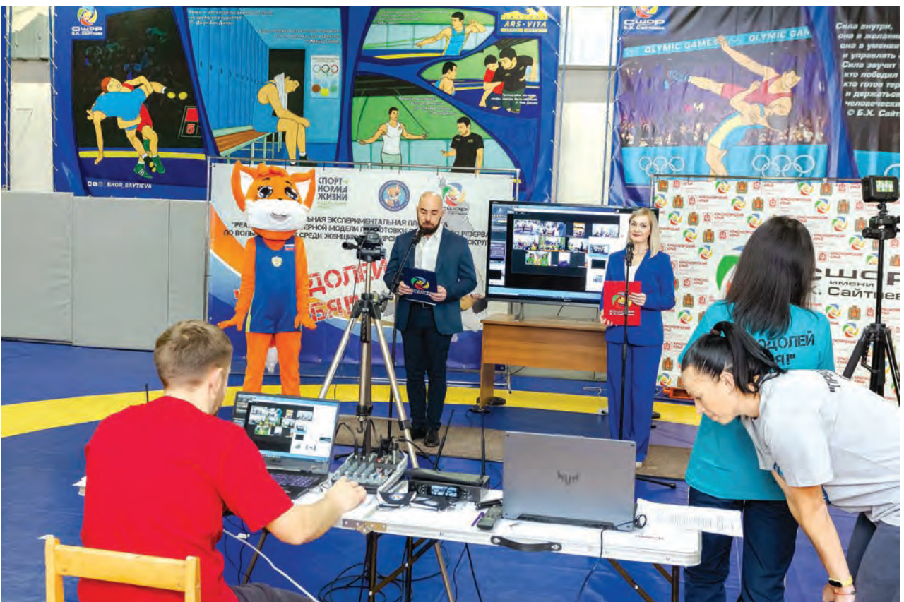
Финал проекта в онлайн-режиме