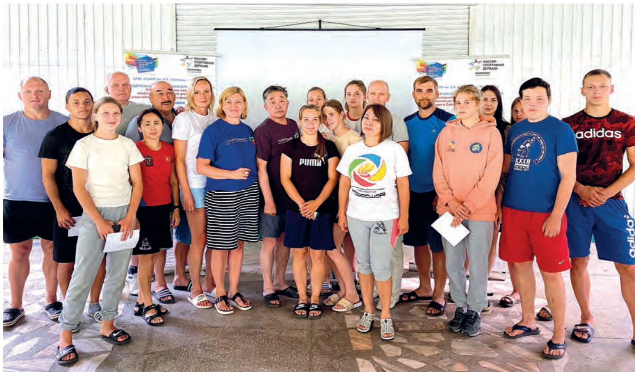
Участники семинара и программы повышения квалификации в рамках ФЭП

общественным фондом развития спортивной женской борьбы», в 2020 году стали победителями в конкурсе на предоставление грантов из федерального бюджета с проектом «Преодолей себя». Задача проекта – развитие и популяризация вольной борьбы среди девочек и девушек, проживающих в малых городах и селах Сибирского Федерального округа.