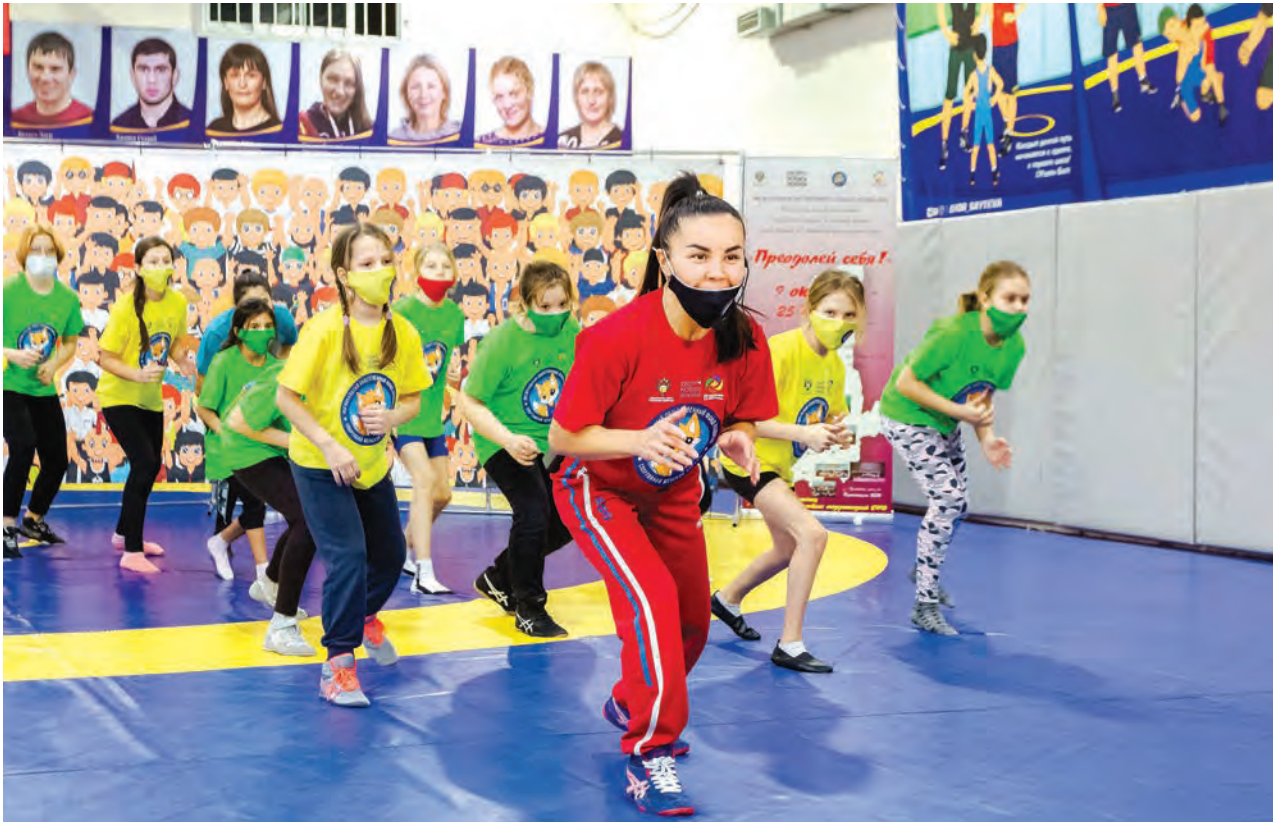
Мастер-класс в рамках проекта «Преодолей себя»